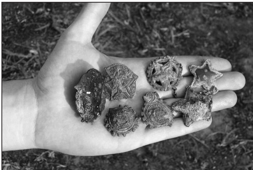
Значки, найденные у убитых красноармейцев