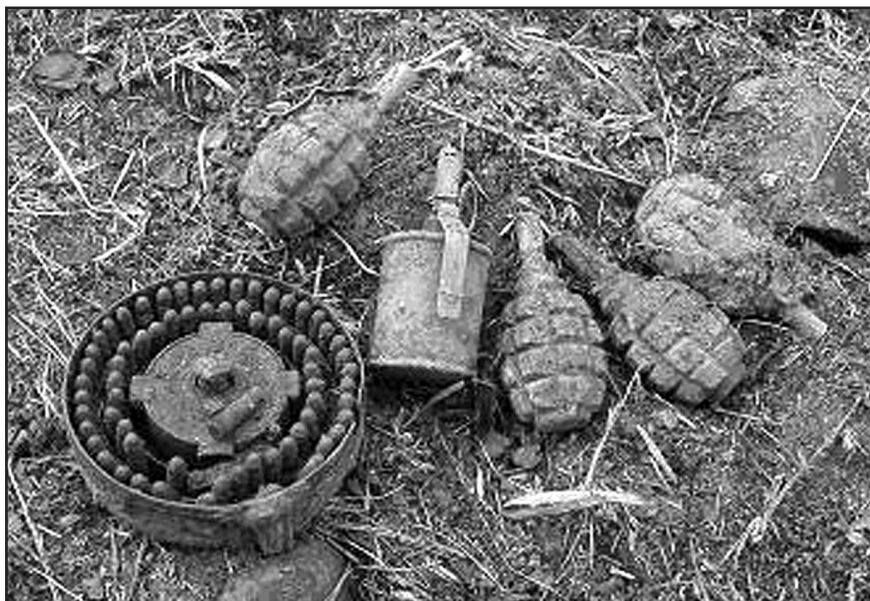
Ручные гранаты. Ими так никто и не воспользовался

нение прибывало и сразу отправлялось в бой. Но немец из пулемётов их как косой косил. Полегли все. Перед немецкими позициями всё было изрыто снарядами и устлано кучами трупов, которых убрать было не возможно. Убитые и раненые падали сверху. Раненые тянулись, ползли, но вскоре умирали от ран или замерзали. Живые прятались от огня противника в воронках или за кучами оочевевших на морозе трупов.