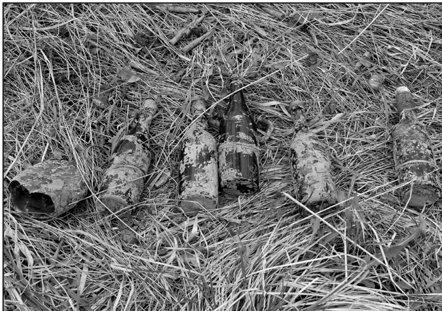
Бутылки с коктейлем Молотова

Вновь поступил приказ сменить позиции. Новым участком оказались позиции отошедшего в тыл Гусевского тринадцатого кавалерийского корпуса под станцией Глубочкой. Вся 2-я ударная армия занимала по фронту уже не больше 150 километров. В окружении людей заметно поубавилось. От позиций полка до позиций ближайших соседей по прямой было чуть больше четырёх километров. Для связи к ним периодически отправляли свя-