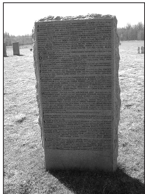
Мемориальное немецкое кладбище в Корпово