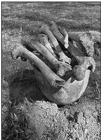
Ещё один солдат без медальона