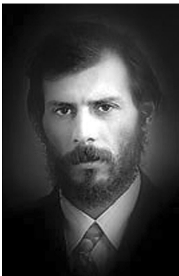
Заслуженный журналист Украины. Участник боевых действий в Афганистане